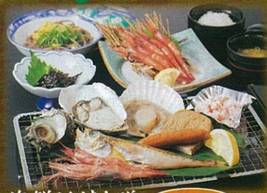
海鮮浜焼き膳 2名様より