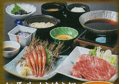
但馬牛すき焼き鍋 2名様より